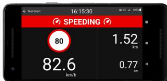
Note the speeding message.