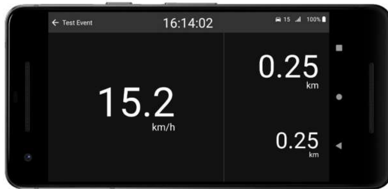
Main Screen off stage when tracking.

Klik op start tracking wanneer u met de verkenning begint.