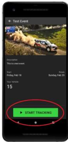
Click start tracking when beginning recce.

Nadat u met uw code bent ingelogd op het evenement, toont het hoofdscherm uw huidige snelheid en twee kilometertellers. Beide kilometertellers kunnen worden gereset door de kilometerteller ingedrukt te houden.