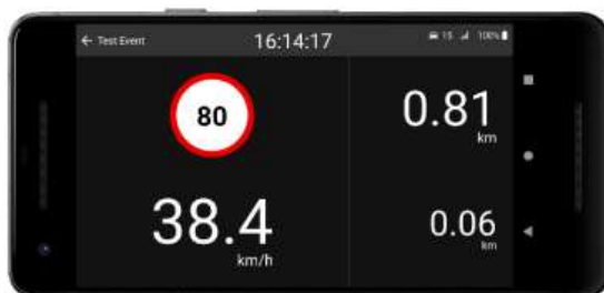
80kph is the speed limit.

Wanneer je bij een klassementsproef aankomt, toont het scherm de maximaal toegestane km/h samen met de kilometerteller en je huidige snelheid. Als u de snelheidslimiet overschrijdt, verschijnt er een rode snelheidsbalk bovenaan het scherm.